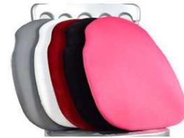
Housse pour galet : 1.80 € TTC/pièce Pour Chaise « Napoléon »