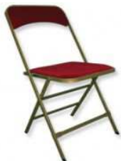
Chaise Pliante Apolline velours : 6.00€ TTC/pièce (Coloris : Rouge - Vert - Noir)