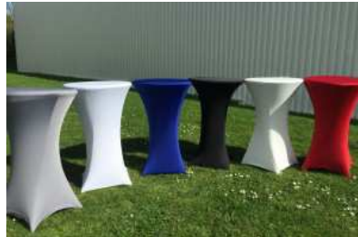
Mange debout + housse - 43.60 € TTC/pièce