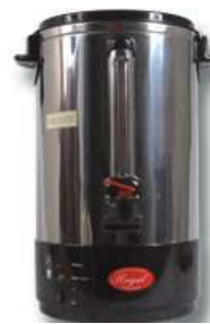
Percolateur : 65.30 € TTC/pièce