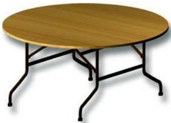
Table Ronde 8-10 personnes Diam 150 - 17.60 € TTC/pièce Table Ronde 10-12 personnes Diam 180 - 27.60 € TTC/pièce