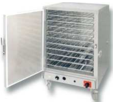
Étuve ventilée 600*800 : 180.00 € TTC/pièce