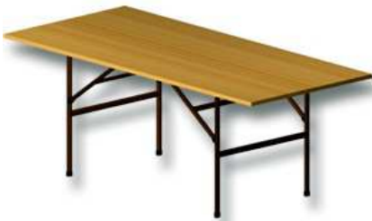
Table buffet/cocktail 150*90 - 16.90 € TTC/pièce Table buffet/cocktail 200*90 - 18.90 € TTC/pièce