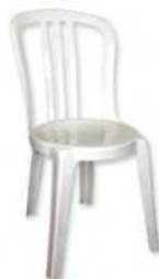
Chaise PVC Miami : 2.80 TTC/pièce