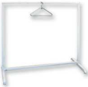
Portant vestiaire + 50 cintres 56.80 € TTC/pièce