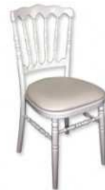
Chaise Napoléon 9.20 € TTC/pièce (Coloris : blanc - Argent - Noir)