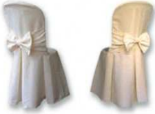
Housse de Tissu avec nœud ou lacet 7.90 € TTC/pièce Pour Chaise "Miami"