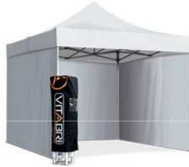
Tente 3m*3m : 155.70 € TTC/pièce