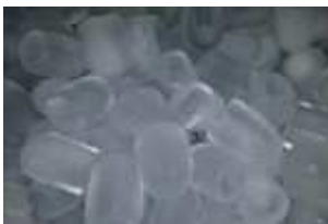
Glaçons 10 kg : 20.00 € TTC/pièce